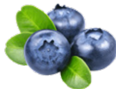
Масло семян черники